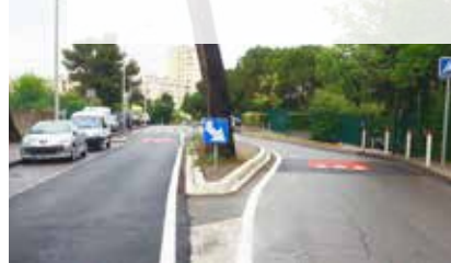
SAINT-JULIEN (13012) Sécurisation sortie résidence Bougainvilliers et aménagement angle Amaryillis / Bousquetier : 65 000 euros

Montant total des travaux réalisés en 2016 : 3 200 000 €