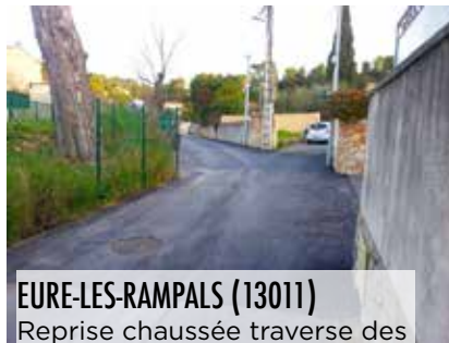
EURE-LES-RAMPALS (13011) Reprise chaussée traverse des Marronniers : 80 000 euros