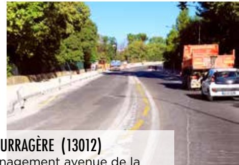
LA FOURRAGÈRE (13012) Aménagement avenue de la Fourragère des Caillols aux Borromées : 450 000 euros