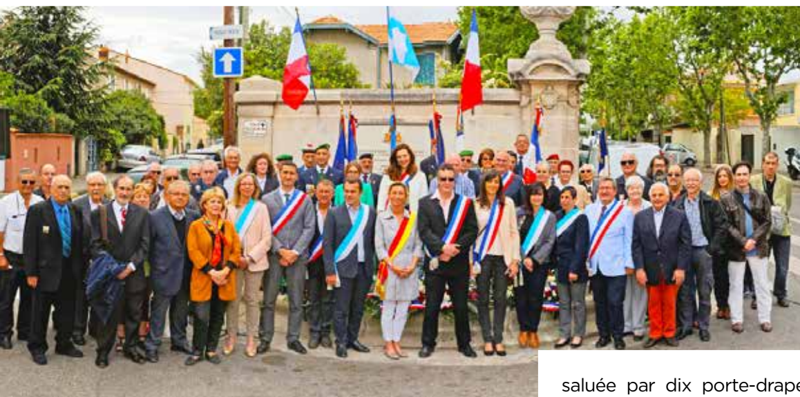
Commémoration du 8 mai 1945 à Bois-Luzy - Mai 2016

Le sixième secteur de Marseille est celui qui comporte le plus de monuments aux morts.