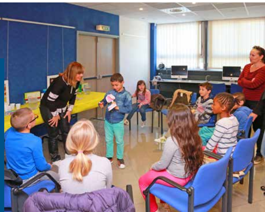
Journée de l'hygiène bucco-dentaire en Mairie de secteur - Avril 2016