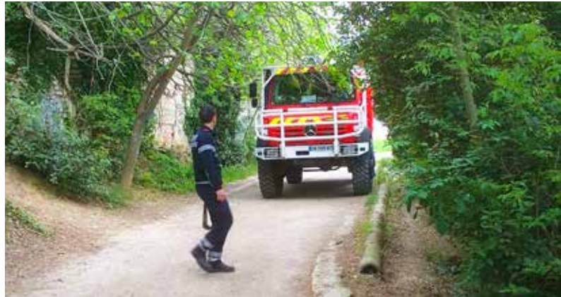
Visite de repérage avec les Marins Pompiers sur le canal de St-Julien