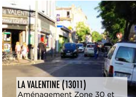
LA VALENTINE (13011) Aménagement Zone 30 et plateau traversant Route des Trois Lucs à la Valentine : 250 000 euros