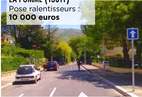
LA POMME (13011) Pose ralentisseurs : 10 000 euros