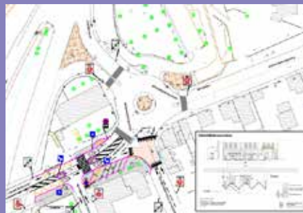
LES TROIS LUCS (13012) Aménagement d'une zone 30 et d'un plateau traversant sur l'avenue des Trois Lucs : 250 000 euros