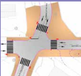
LES CAILLOLS (13012) Aménagement d'un carrefour à feux sur l'avenue des Caillols au carrefour Malosse-Sariette : 245 000 euros