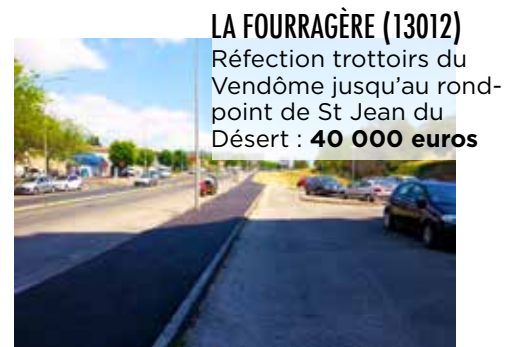
LA FOURRAGÈRE (13012) Réfection trottoirs du Vendôme jusqu'au rond- point de St Jean du Désert : 40 000 euros