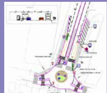
LA BARASSE (13011) Création d'un rond-point pour l'aménagement et la sécurisation du carrefour Bancal-Barasse : 280 000 euros