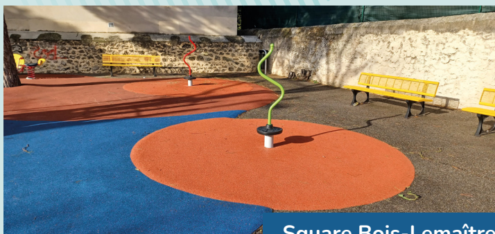
Square Bois-Lemaître Boulevard Jean Compadiou 13012