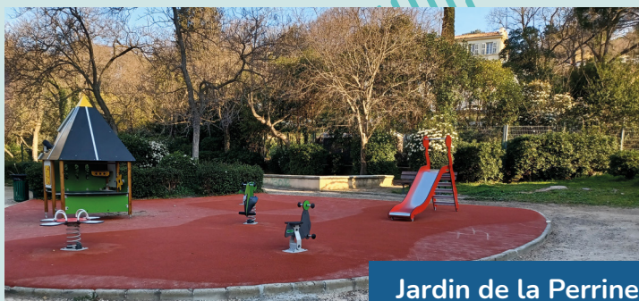
Jardin de la Perrine Avenue des Borromées 13012