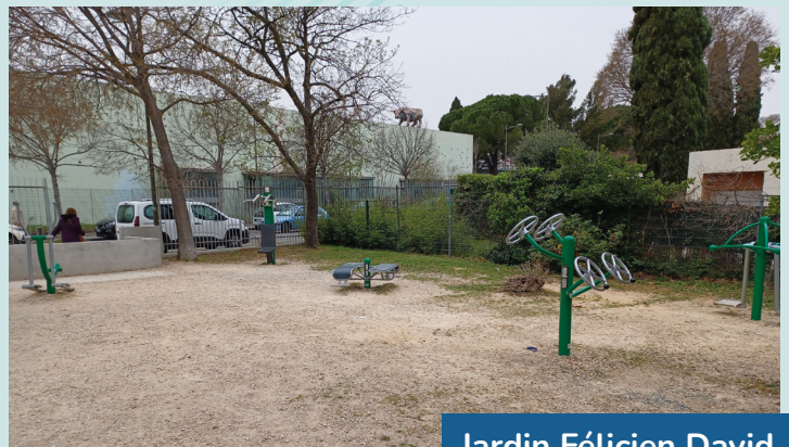
Jardin Félicien David Avenue d'Haïti 13012