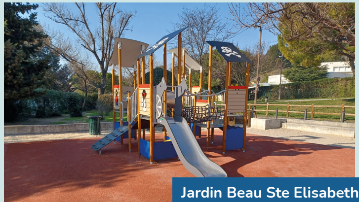
Jardin Beau Ste Elisabeth Rue Beau 13012

Encourager la pratique sportive de tous les publics, le secteur s'est modernisé et a procédé à la rénovation de divers jardins pour enfants et agrès sportifs dont voici quelques exemples :