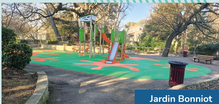
Jardin Bonniot Boulevard Bonniot 13012