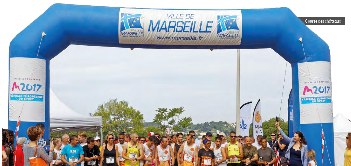
Course des châteaux

L'été dans les 11&12 sera principalement dédié à la culture avec les festivals de la Moline et de la Buzine mais le sport reviendra sur le devant de la scène dès le mois de septembre avec la rentrée des associations sportives, la nuit des sports de combat et la marche des séniors (cf : agenda en page 10).