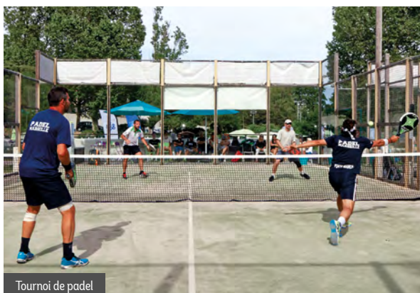
Tournoi de padel

E n effet, notre secteur fait partie de ceux qui accueillent le plus d'événements labellisés MPSport 2017 : 9 projets sportifs sont proposés tout au long de l'année, en plus des nombreuses manifestations sportives dans tous nos quartiers à l'initiative des clubs et associations.