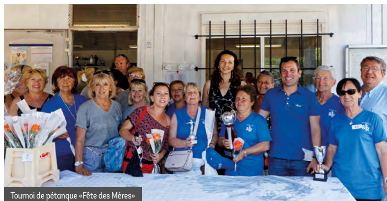
Tournoi de pétanque «Fête des Mères»

La Grande Bastide Cazaulx verra également son stade prochainement engazonné d'une pelouse synthétique. Le démarrage des travaux a eu lieu en présence de Martine Vassal et de très nombreux