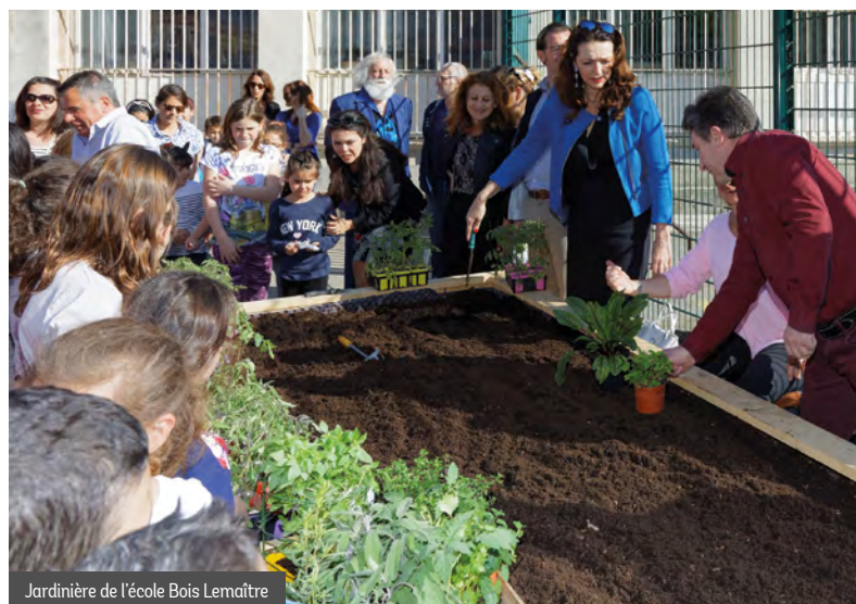
Jardinière de l'école Bois Lemaître

Ce concours contribue considérablement à l'embellissement de nos quartiers, à la préservation de la biodiversité en ville, à la valorisation des espaces verts et surtout à une meilleure qualité de vie.