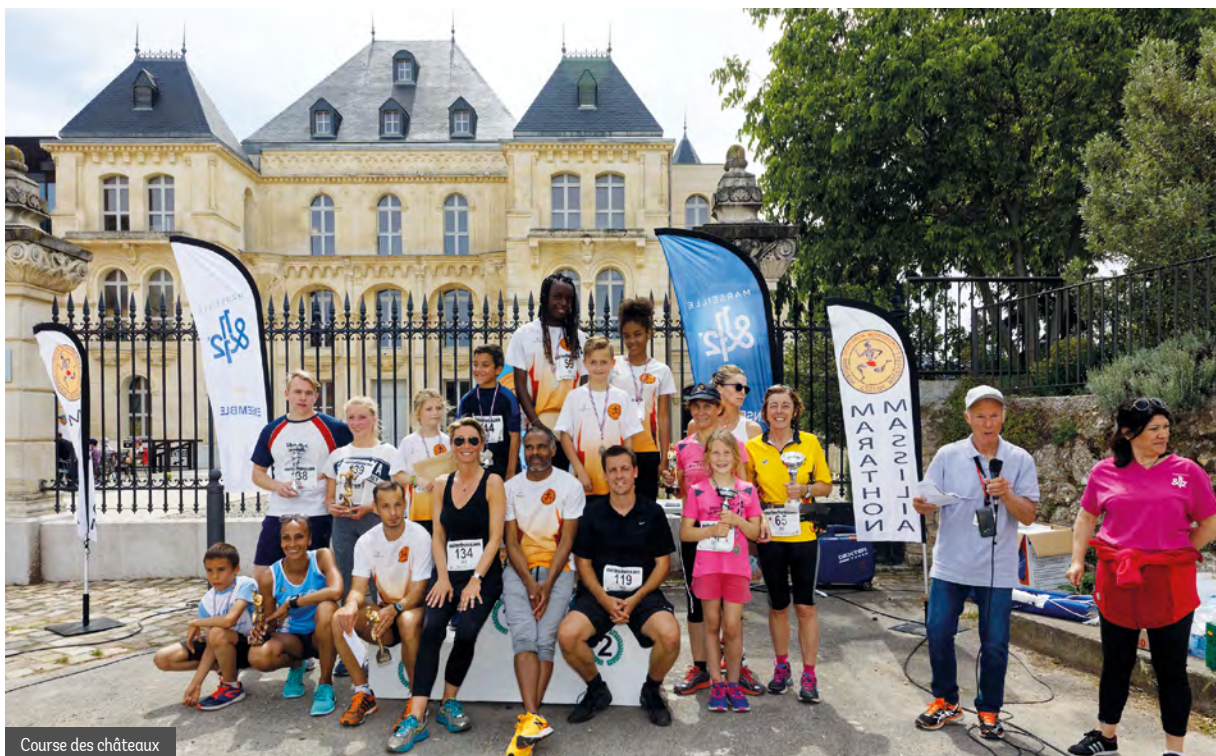
Course des châteaux

Pour l'année capitale européenne du sport 2017 à Marseille, les 11&12 font la course en tête !