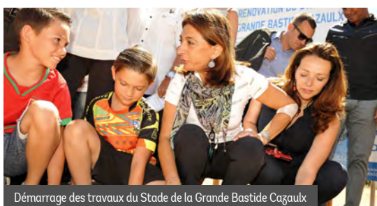
Démarrage des travaux du Stade de la Grande Bastide Cazaulx

Le réaménagement des accès et des abords du stade est également prévu. Une vraie transformation de ce quartier qui sera achevée en décembre 2017 !