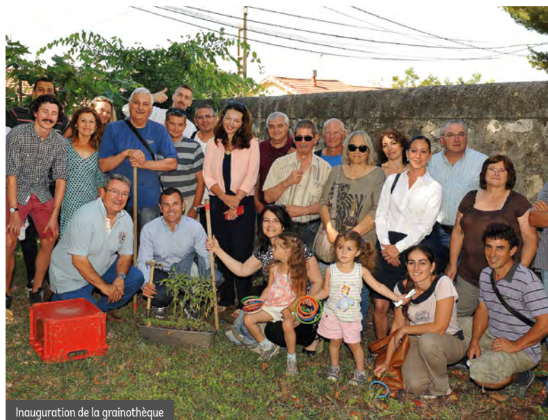
Inauguration de la grainothèque

Ce concours contribue considérablement à l'embellissement de nos quartiers, à la préservation de la biodiversité en ville, à la valorisation des espaces verts et surtout à une meilleure qualité de vie.