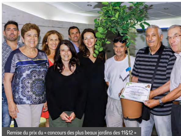
Remise du prix du « concours des plus beaux jardins des 11&12 »

Les jardiniers du secteur ont eux aussi été mis sur le devant de la scène avec le «concours des plus beaux jardins des 11&12». Particuliers, associations, écoles ou clubs : leurs efforts ont été récompensés comme il se doit à l'occasion d'une soirée festive de remise des prix en Mairie des 11&12 !